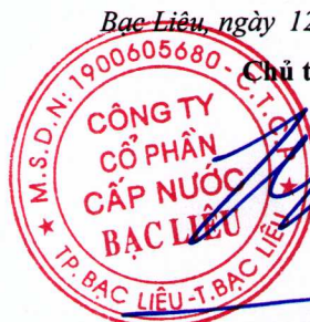
Trần Phước An